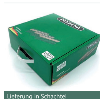
Lieferung in Schachtel