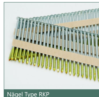
Nägel Type RKP