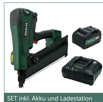
SET inkl. Akku und Ladestation